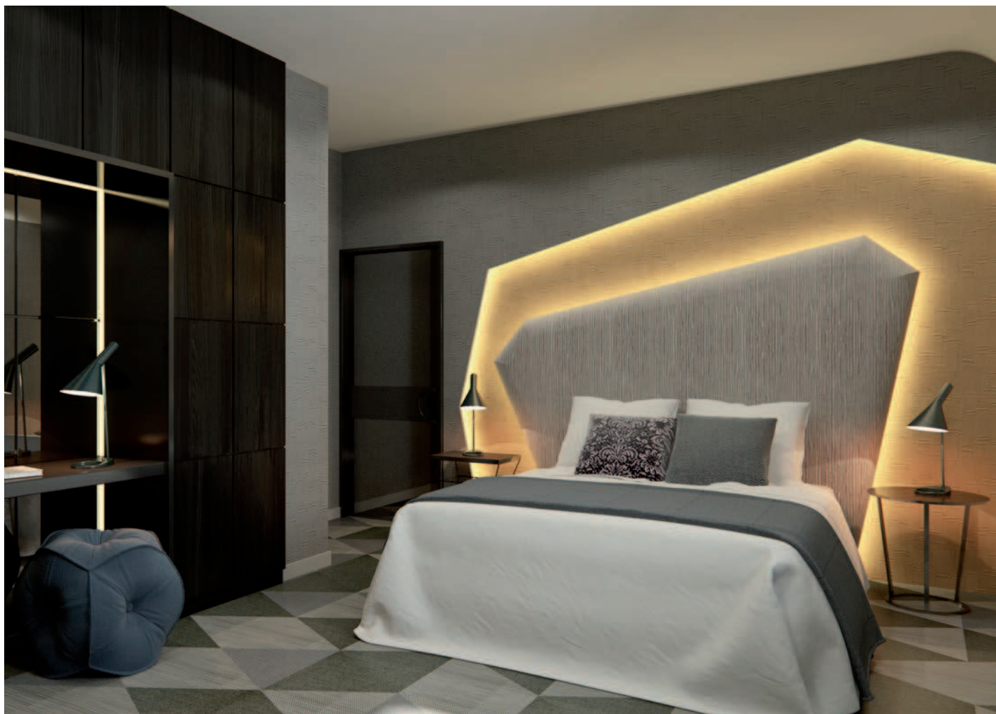
Alojamiento turístico Faro Isla Pancha (Ribadeo, Lugo) / Tourist accommodation Faro Isla Pancha (Ribadeo, Lugo). Spain

In what way was your work affected by the economic crisis?