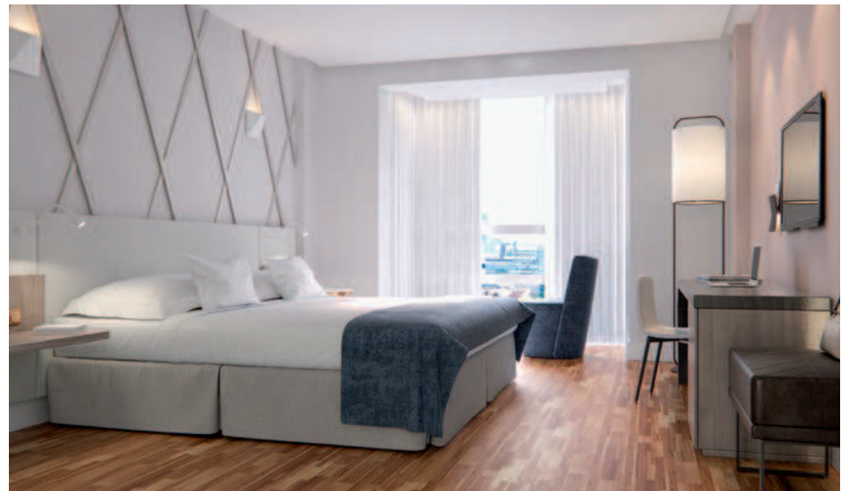
Propuesta para hotel en Madrid, realizada para Ilunion Hotels / Proposal for a Hotel in Madrid, designed for Ilunion Hotels