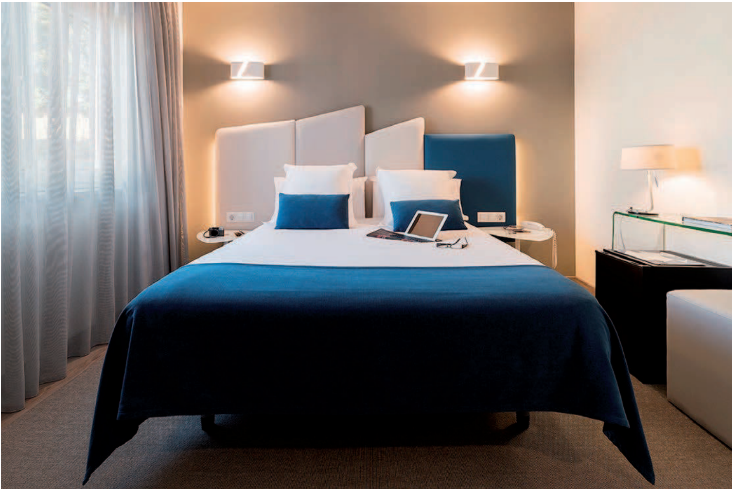
Hotel Boa Vista en Viveiro, Lugo. España / Boa Vista Hotel in Viveiro, Lugo. Spain

Cuando os contacta un cliente para llevar a cabo un proyecto, ¿qué es lo que espera de PF1? ¿Qué ofrece vuestro estudio que marca la diferencia?