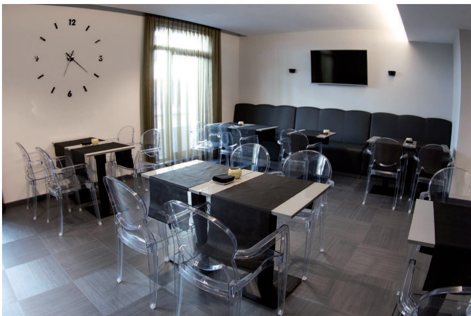
Cafetería del hotel con cortinas de Jover./ The Hotel Cafeteria with curtains from Jover.

Being an old apartment building, the main difficulty of the project was the fact that the hotel reception on the ground floor could not be used for lack of space. "We literally turned it on its head in order to make it look like a visual stronghold" say Proxectos F1. Since the access was a portal of reduced dimensions and there was no space for a welcome area, the solution was to locate this zone in the ceiling area in such a way that access upstairs was not impeded.