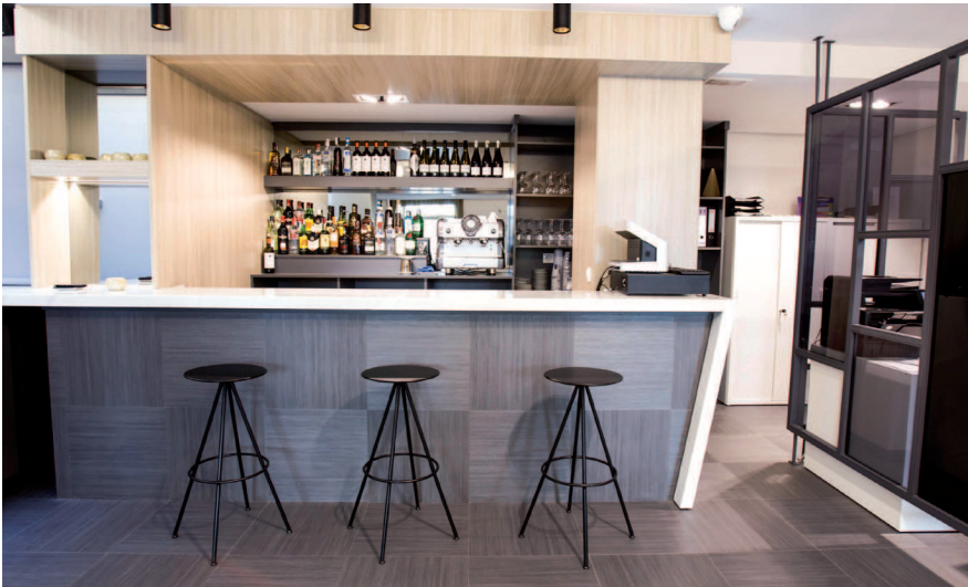
Banquetas de Inclass en la zona de bar./ Inclass Stools in the bar area.