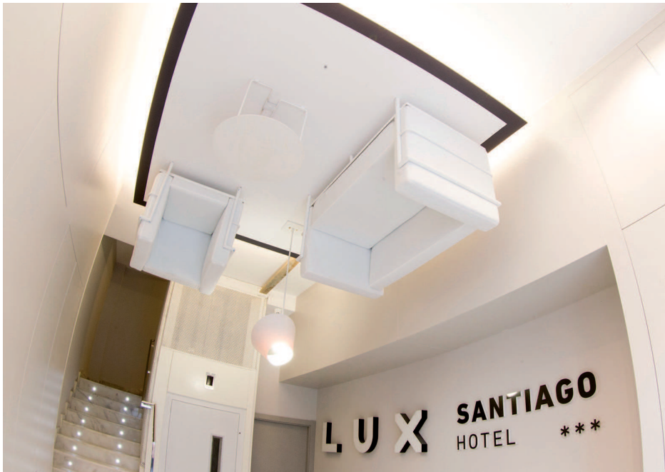
Sorprendente solución para ubicar el mobiliario de recepción./ A surprising solution for locating furniture for the reception.