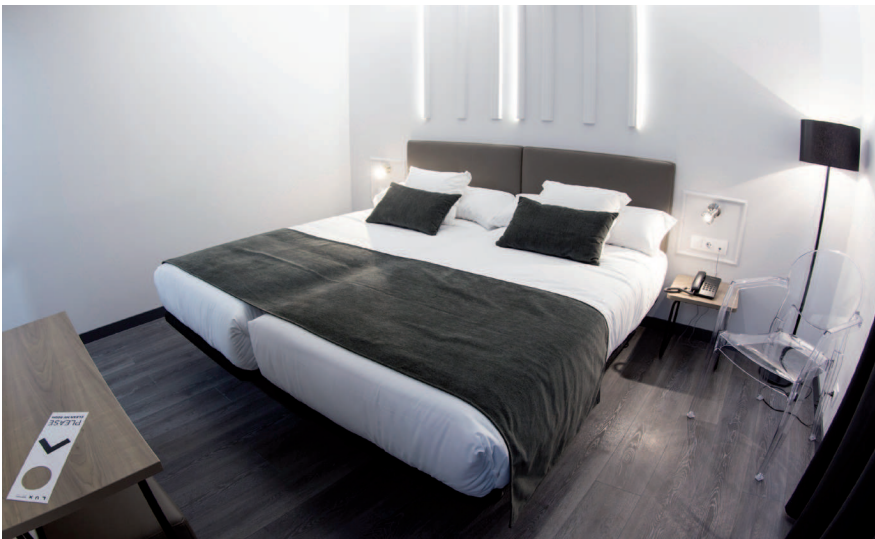
Un hallazgo de este proyecto: las molduras de Orac Decor que hacen de cabecero. / A novel idea for this project: Orac Décor moulds that create the headboard.

tal: que fuesen muy funcionales, además de seguir manteniendo la luz como eje conductor. “Esto lo conseguimos con mobiliario muy ligero visualmente, basado en estructuras metálicas y polipropileno transparente”. El punto fuerte de la habitación son las molduras, que hacen de cabecero y continúan por el techo, dando mucha luminosidad a la habitación sin deslumbrar. ■